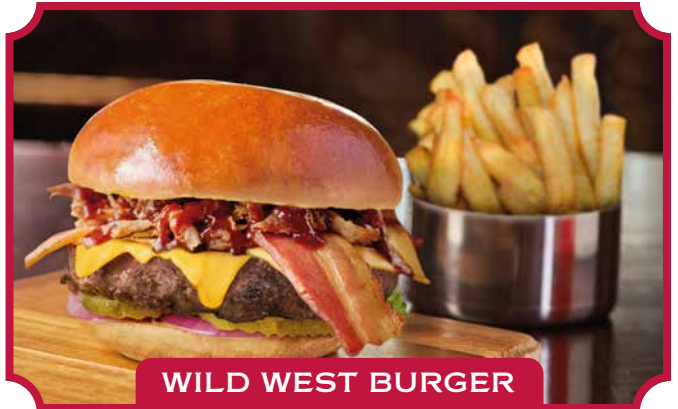
WILD WEST BURGER

Hamburguesa de ternera coronada con Pulled Pork (Suave carne de cerdo horneada a la perfección desmenuzada y bañada en nuestra salsa Texas Special BBQ), queso cheddar fundido, bacon, cebolla y pepinillos. 15,50 €