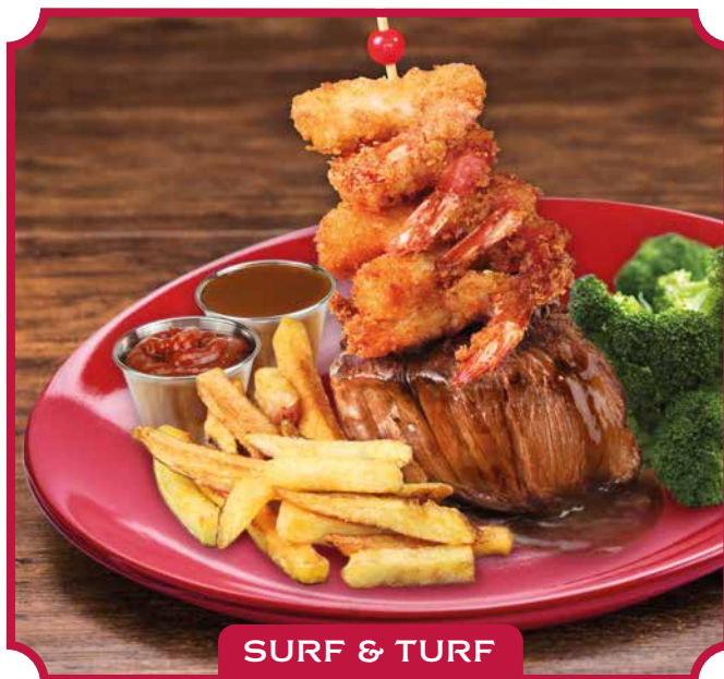
SURF & TURF

Fritas y doradas, puré de papas naturales con queso y bacon o nuestra papa al horno con queso, bacon y sour cream.