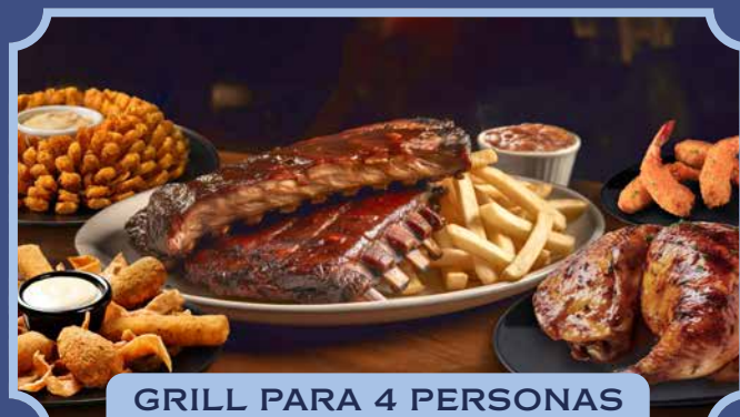
GRILL PARA 4 PERSONAS