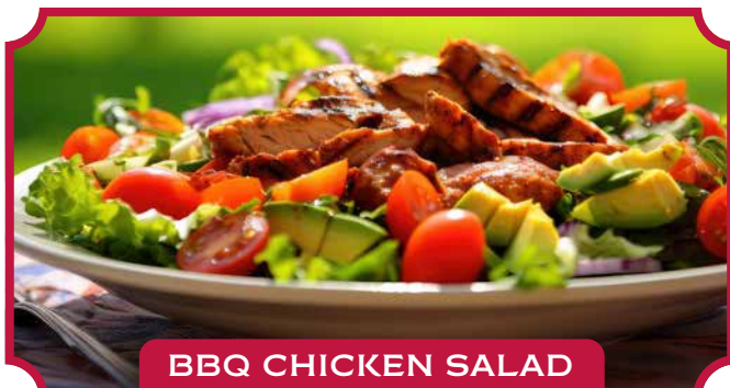
BBQ CHICKEN SALAD

Leckere gegrillte Hähnchenbrust mit BBQ-Sauce, frischem Salat, Tomaten, Avocado, Ananas, Käse und knusprigen Speckstücken. Mit unserem berühmten Country Vinaigrette beträufelt. Groß: 14,95 € · Mittel: 11,95 €