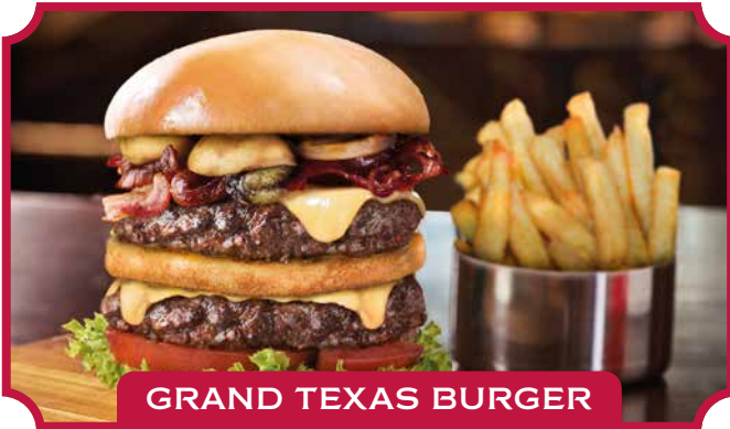
GRAND TEXAS BURGER

Der grösste und leckerste Hamburger aus Rindfleisch, den man sich vorstellen kann. Mit doppeltem Fleisch, Champignons, Speck, Salat, Tomaten, Gruyère-Käse und Mayonnaise. Serviert mit Pommes Frites und Krautsalat. 18,70 €