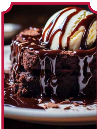
BROWNIE & SUNDAE