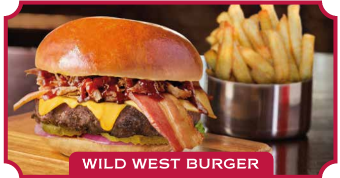
WILD WEST BURGER

Rindfleisch-Burger mit Pulled Pork (Pulled Pork ist eine zarte, geräucherte Schweineschulter, die zerkleinert und mit einer rauchigen, süßen Barbecue-Sauce überzogen wird), geschmolzenem Cheddar-Käse, Speck, Zwiebeln und Essiggurken. 15,50 €