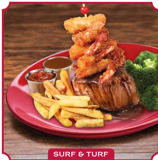
SURF & TURF