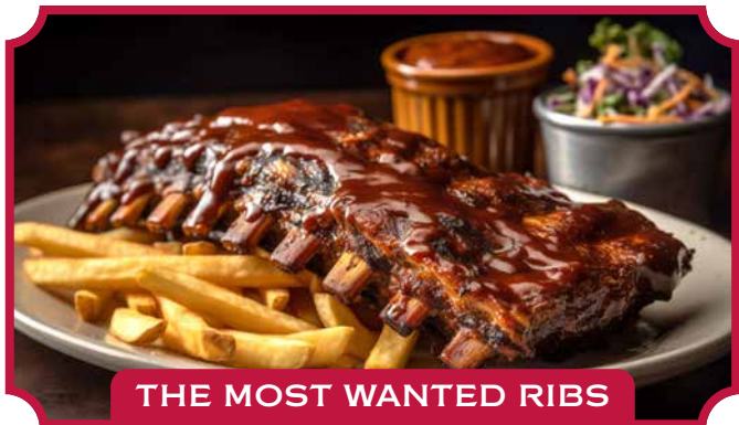
THE MOST WANTED RIBS

Unsere weltweit berühmte Baby Back Ribs werden perfekt gegrillt; großzügig mit unserer Texas Special BBQ-Sauce übergossen, serviert mit Pommes frites, Ranch-Bohnen und Krautsalat. 25,25 €