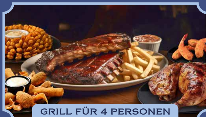
GRILL FÜR 4 PERSONEN