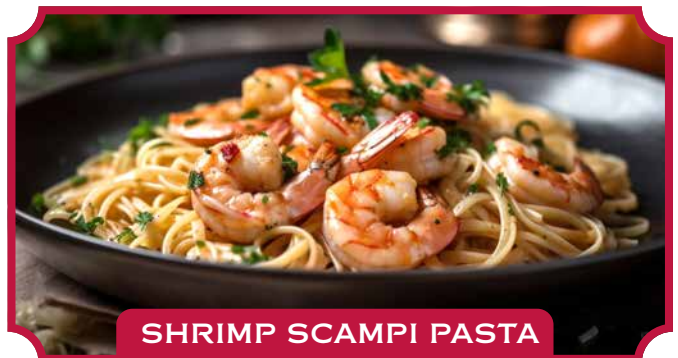
SHRIMP SCAMPI PASTA

Großzügige Portion Garnelen, leicht sautiert mit Knoblauch, frischem Basilikum, gerösteten Tomaten, Pesto und einem Hauch von Chipotle. Serviert auf Linguine-Nudeln mit Asiago-Käse. Ein einzigartiges Geschmackserlebnis!. 17,75 €